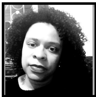
RAQUEL SILVA COMUNICAÇÃO E EXPRESSÃO