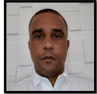
LUIZ FERNANDO TEODORO CUSTOS INDUSTRIAIS ECONOMIA INTRODUÇÃO À CONTABILIDADE