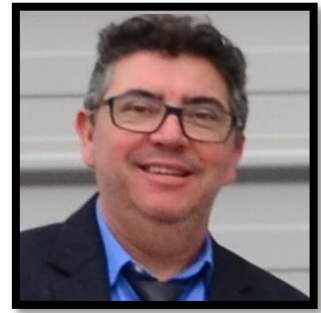
JORGE LUIZ ROSA MATERIAIS E TRATAMENTOS I