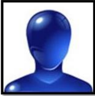
MARCELUS ALEXANDER ACORINTE VALENTIM SISTEMAS DE MOVIMENTAÇÃO E TRANSPORTE