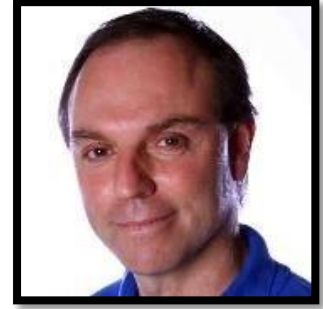
PATRICE LONDON GUEDES TRANSPORTE AÉREO