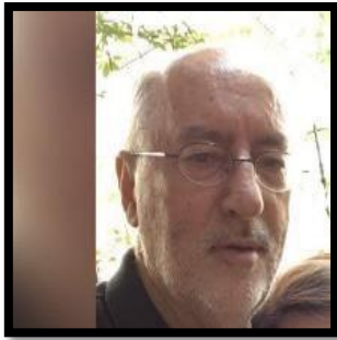
GERMANO MANUEL CORREIA GESTÃO DE TRANSPORTE DE CARGA ROTEIRIZAÇÃO