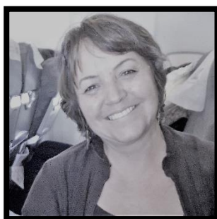
LÍGIA DUARTE GUERRA MODALIDADE E INTERMODALIDADE MOVIMENTAÇÃO E ARMAZENAGEM