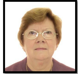
WANNY ARANTES BONGIOVANI DI GIORGI CONTABILIDADE CUSTOS E TARIFAS LOGÍSTICAS ECONOMIA E FINANÇAS EMPRESARIAIS GESTÃO TRIBUTÁRIA