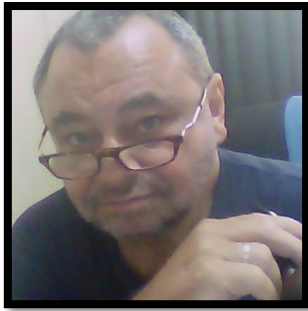
EDUARDO FACCHINI EMBALAGEM E UNITIZAÇÃO DE CARGAS INOVAÇÃO E EMPREENDEDORISMO