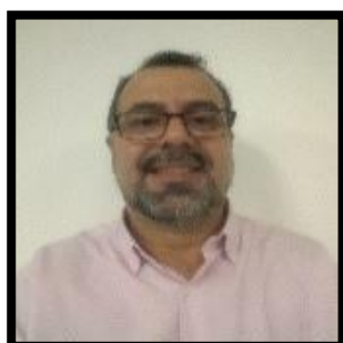
DERMEVAL SANTOS CERQUEIRA CÁLCULO I; CÁLCULO DIFERENCIAL E INTEGRAL ESTATÍSTICA APLICADA À GESTÃO MATEMÁTICA FINANCEIRA